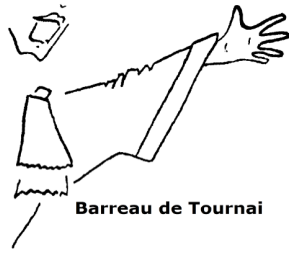
Belgique – Barreau de Tournai