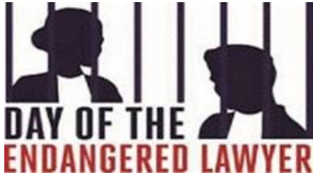
Day of the Endangered Lawyer

À l'occasion du trentième anniversaire des Principes de base des Nations Unies relatifs au rôle du barreau et compte tenu de ce qui précède, le CCBE et toutes les organisations signataires appellent donc à une application plus effective des garanties fournies par les Principes de base des Nations Unies relatifs au rôle du barreau et réitère son soutien ferme aux travaux menés par le Conseil de l'Europe pour une future Convention européenne sur la profession d'avocat, considérant qu'un tel instrument contraignant spécifique est nécessaire afin de préserver l'indépendance et l'intégrité de l'administration de la justice et l'état de droit.