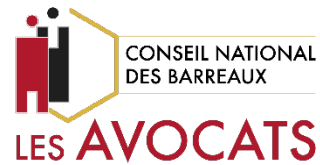
France – Conseil national des barreaux