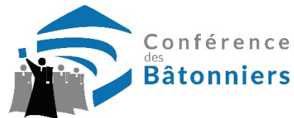
France – Conférence des Bâtonniers