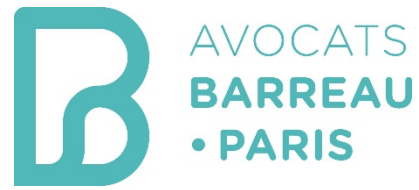
France – Ordre des avocats de Paris