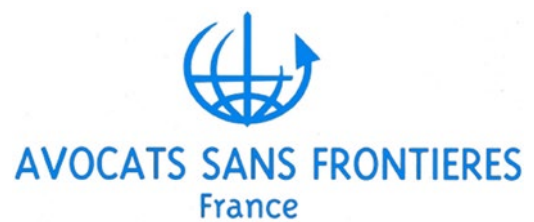
France – Avocats sans Frontières