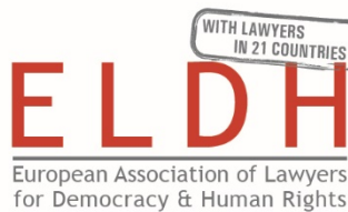
ELD H European Association of Lawyers for Democracy and World Human Rights