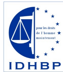
France – l'Institut des droits de l'homme du Barreau de Paris