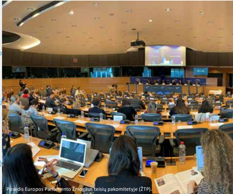
Posėdis Europos Parlamento Žmogaus teisių pakomitetyje (ŽTP).