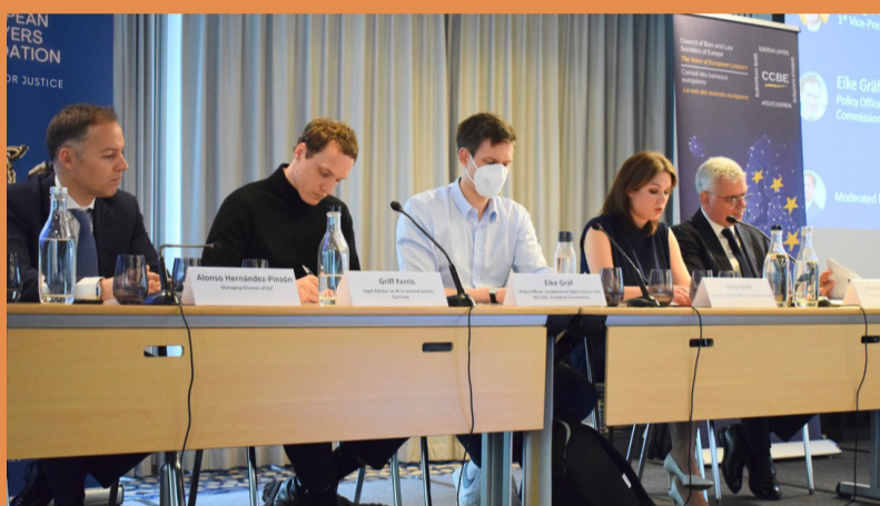
Ponentes del segundo panel