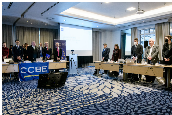
Se guardó un minuto de silencio al comienzo del Comité Permanente