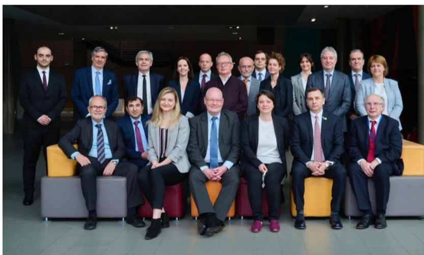
Participantes del CJ-AV en Estrasburgo

Primera reunión del Comité de Expertos del Consejo de Europa sobre la protección de los abogados (CJ-AV)