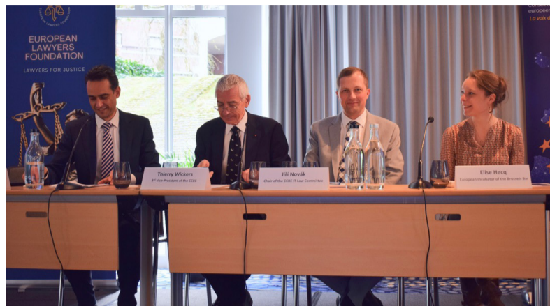
Ponentes del primer panel