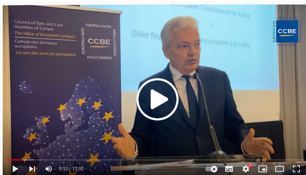
Speech by Didier Reynders, European Commissioner for Justice

CCBE celebró su Comité Permanente el 1 de abril de 2022 en Bruselas con la participación del Comisario Europeo de Justicia, Didier Reynders, como orador principal. En su discurso, el Comisario subrayó «el papel esencial de los abogados en la salvaguardia y promoción del Estado de Derecho». También explicó cómo la Comisión Europea supervisa la independencia de los abogados en el marco del Informe sobre el Estado de Derecho de la Comisión. Vea el vídeo de su discurso aquí .