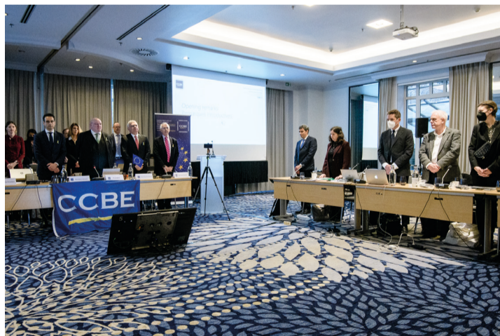
Minuta ciszy na początku posiedzenia Komitetu Stałego