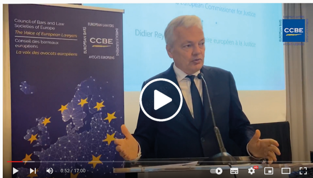
Speech by Didier Reynders, European Commissioner for Justice

1 kwietnia 2022 r. w Brukseli odbyło się posiedzenie Komitetu Stałego CCBE z udziałem komisarza UE ds. sprawiedliwości Didiera Reyndersa, który wygłosił główne przemówienie. Komisarz podkreślił zasadniczą „rolę prawników w ochronie i promowaniu praworządności”. Wyjaśnił również, w jaki sposób Komisja Europejska monitoruje niezależność prawników w ramach prac nad sprawozdaniem Komisji dotyczącym praworządności. Video z jego przemówieniem można obejrzeć tutaj .