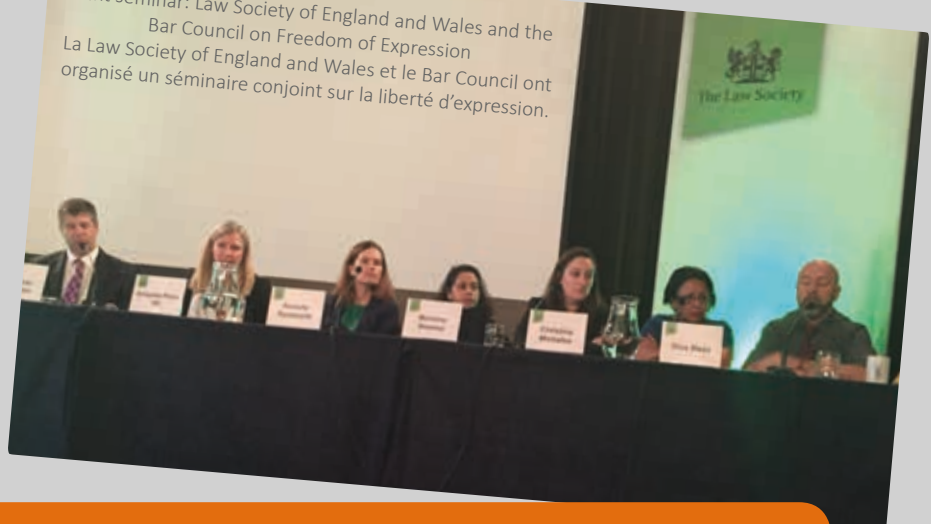
Joint seminar: Law Society of England and Wales and the Bar Council on Freedom of Expression La Law Society of England and Wales et le Bar Council ont organisé un séminaire conjoint sur la liberté d'expression.