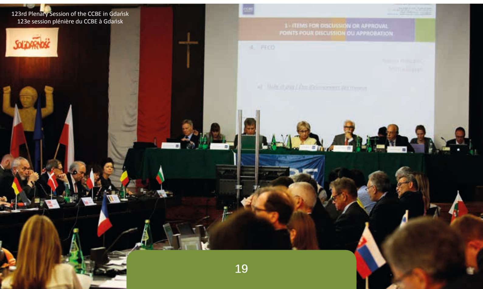
123rd Plenary Session of the CCBE in Gdańsk 123e session plénière du CCBE à Gdańsk