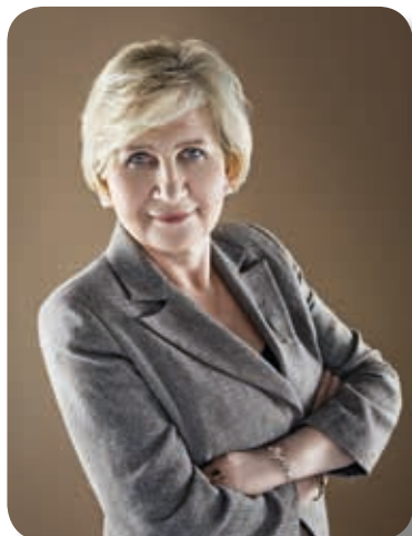
Maria ŚLAŻAK 2015 CCBE President Présidente du CCBE 2015

The brutal terrorist attacks in Paris and around the world in 2015 have shocked Europe. The senseless killings of November 13th are still fresh in my memory. We are afraid of the threat of terrorism, but the reaction to this threat is also worrying. To ensure national security, governments go very far in their measures and legislation, and these very often threaten to limit fundamental rights and freedoms. It is our duty as lawyers to promote these rights and freedoms, which are core values of our democracies, and to expose excesses and abuses. The CCBE has addressed cases in which the confidentiality of client-lawyer communication has been breached. In the Prakken d'Oliveira case in The Netherlands, we have managed to end the unlawful interception of client-lawyer communications by the secret services, as long as there is no adequate procedure to monitor such surveillance. Also in France, we have avoided the possibility for secret services to intercept communications with lawyers, judges, journalists and members of Parliament without prior authorisation.