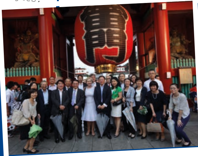
Japan, August 2015