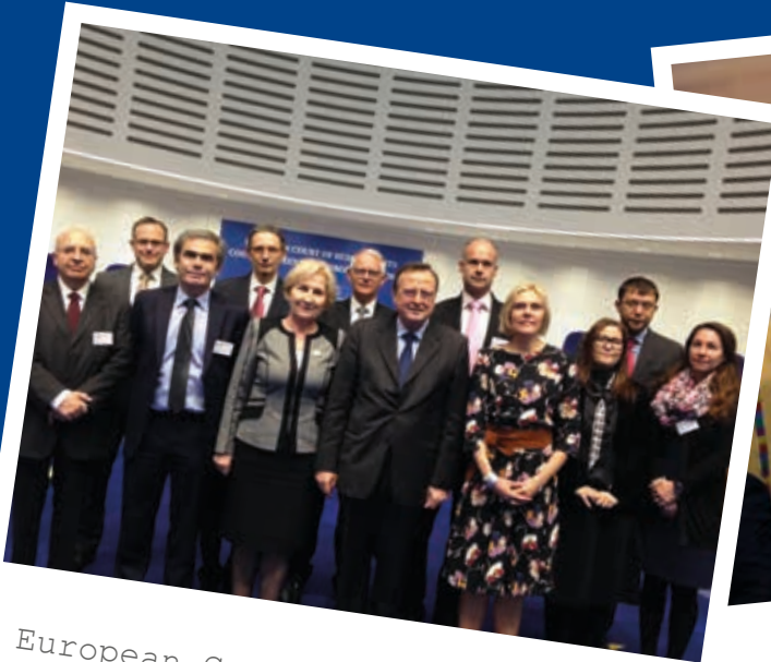
European Court of Human Rights, November 2015