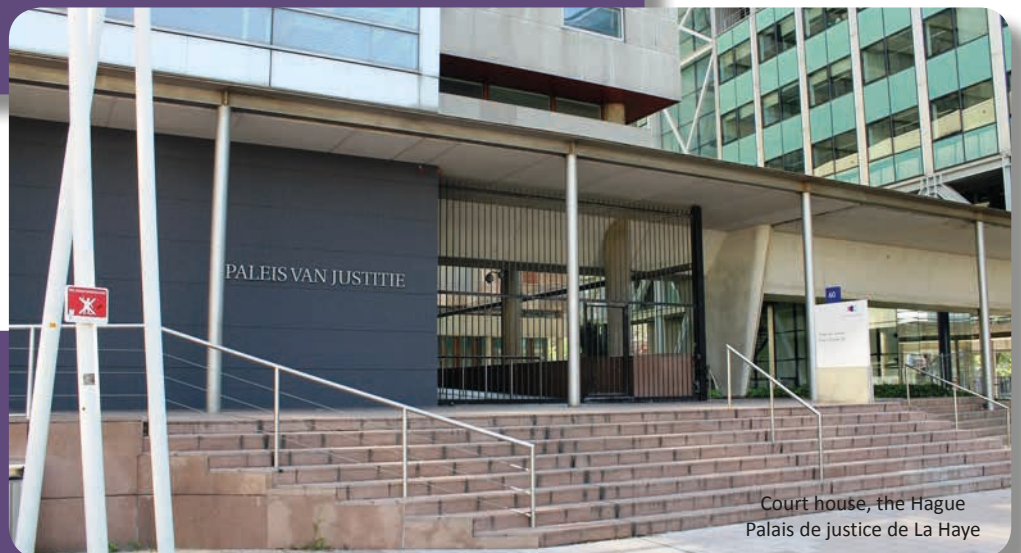
Court house, the Hague Palais de justice de La Haye

More information about the CCBE's intervention in this case can be found on our website.