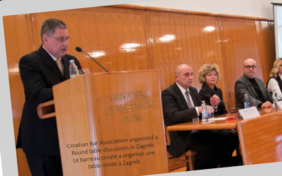
Croatian Bar Association organised a Round table discussion in Zagreb. Le barreau croate a organisé une table ronde à Zagreb.