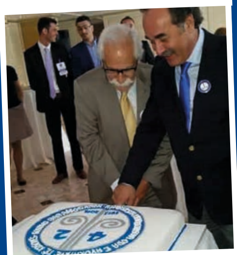
Pristina, June 2015