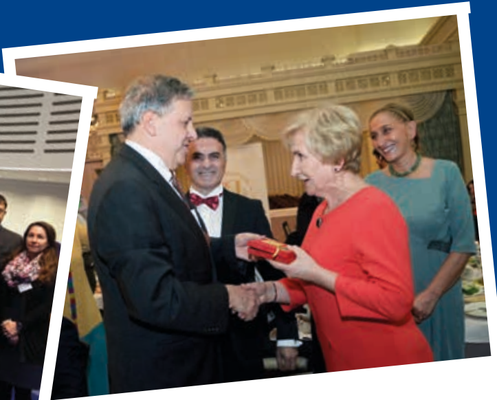
Tbilisi, November 2015