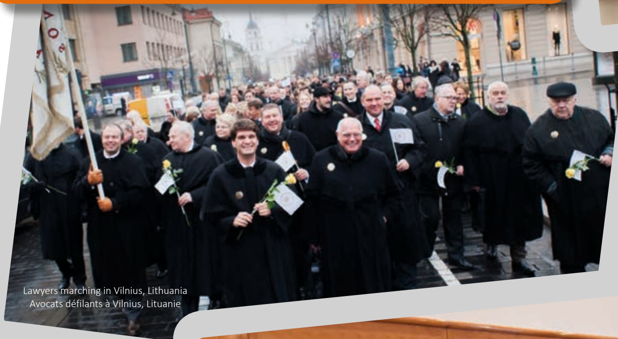
Lawyers marching in Vilnius, Lithuania Avocats défilants à Vilnius, Lituanie

To coordinate this event, the CCBE worked with member bars and law societies at national and regional levels to organise events, publish educational material and/or conduct other programmes that promote citizens' awareness of the European Lawyers Day theme. To assist them in their activities, the CCBE created a promotional poster for marketing the event, as well as a handbook of reference materials, discussion topics, and organisational ideas. The CCBE President prepared a video message for all member bars to be used during the European Lawyers Day events as well as to be published and promoted on their website. A special edition newsletter was published straight after, highlighting just some of the events organised around Europe. All of this information, plus a list of activities of some of our members' countries, can be found on our European Lawyers Day event webpage: www.ccbe.eu/lawyersday .