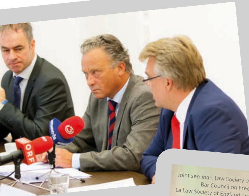
Press conference with the Austrian Bar and the Austrian Association of Judges Conférence de presse organisée par le barreau autrichien et l'association autrichienne des avocats