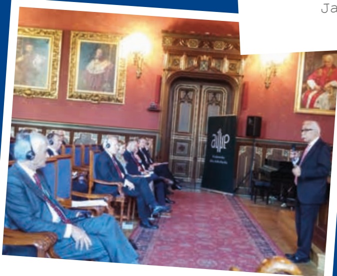
Krakow, October 2015