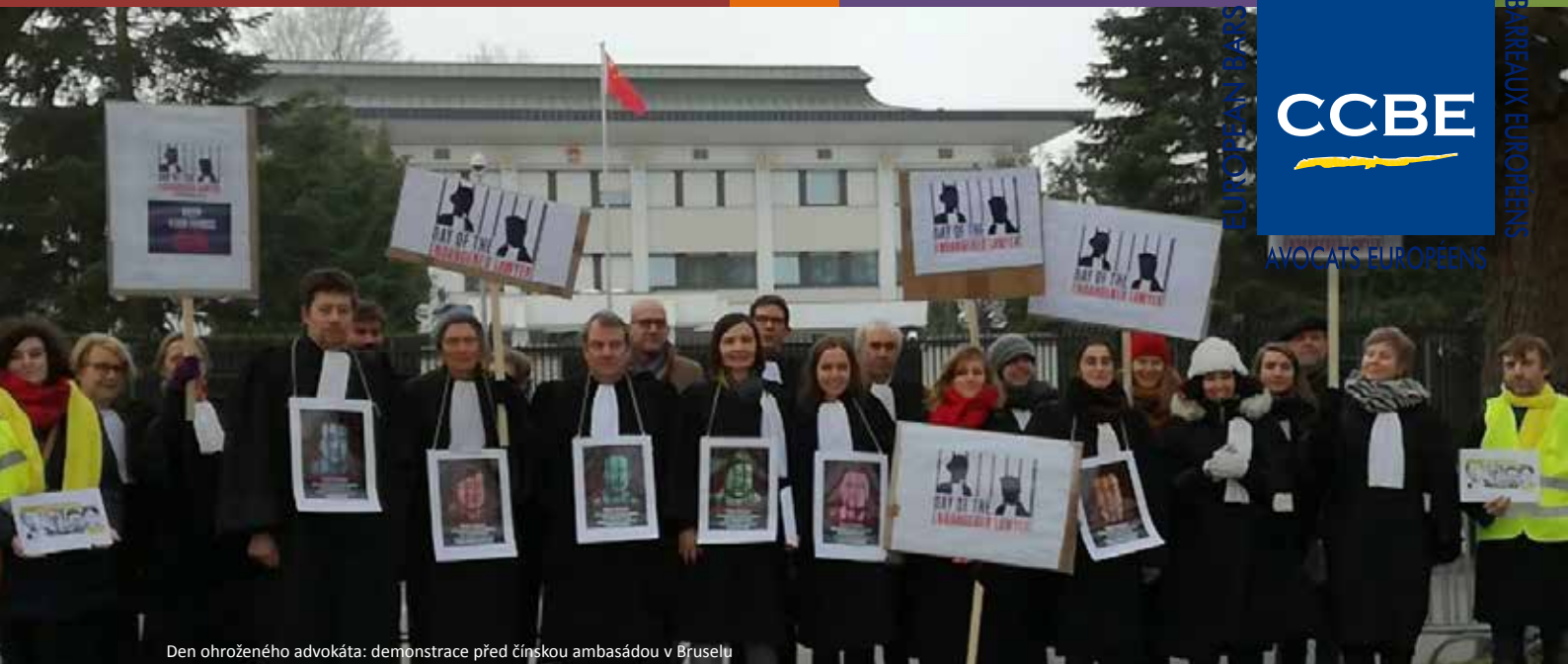
Den ohroženého advokáta: demonstrace před čínskou ambasádou v Bruselu