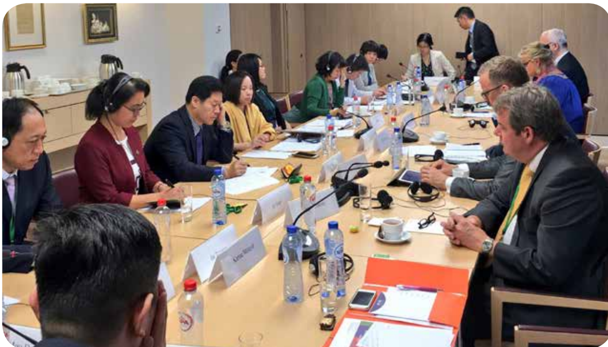
Diálogo DDHH UE – China, Bruselas

prevención de la tortura – afirmaron que la tortura se evita y que se vigila de cerca a guardias. Fuimos invitados a ir a China y comprobarlo de primera mano.