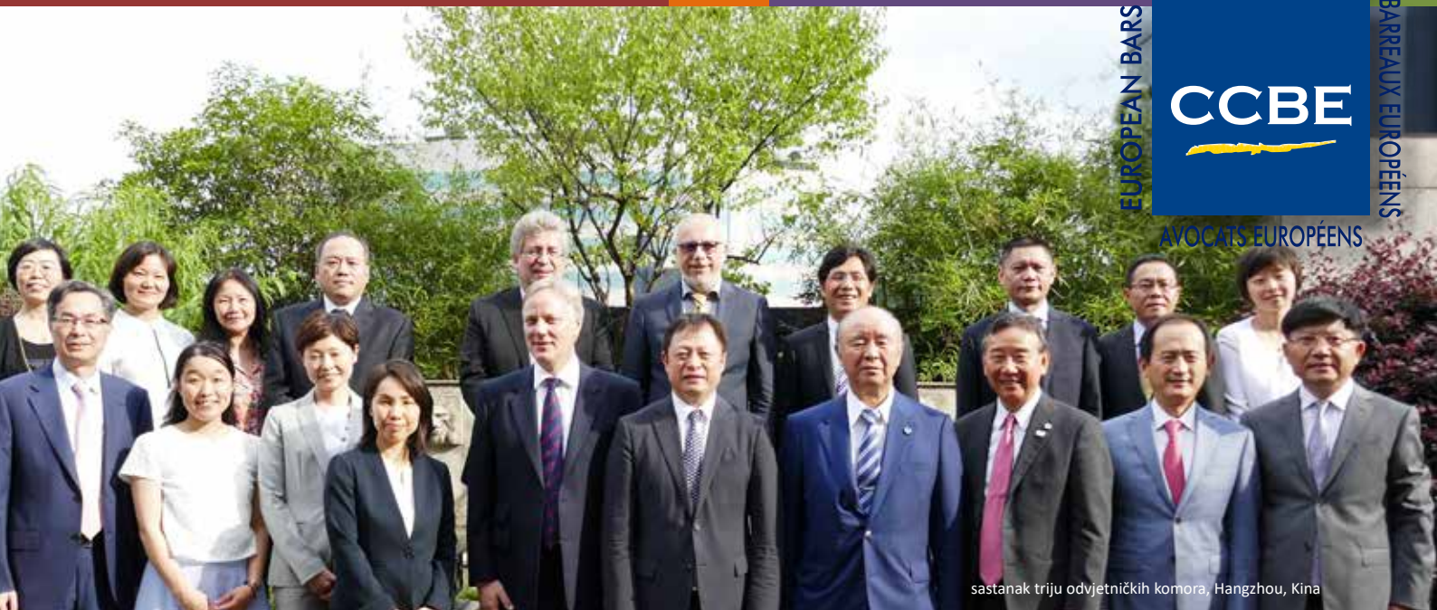
sastanak triju odvjetničkih komora, Hangzhou, Kina