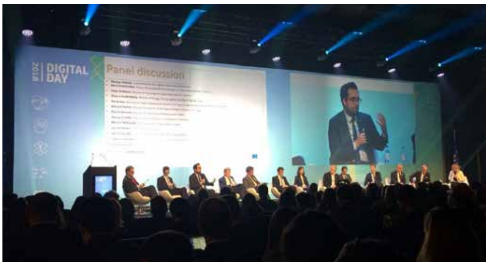
Mounir Mahjoubi, Státní tajemník pro záležitosti digitalizace, se zúčastnil Digitálního dne 10. dubna 2018

Během této události podepsalo 25 zemí Deklaraci ke spolupráci v oblasti umělé inteligence , společný závazek dále spolupracovat na nejdůležitějších otázkách souvisejících s umělou inteligencí (AI). Komisařka Mariya Gabriel připomenula, že aby jakákoli strategie v oblasti umělé inteligence mohla být úspěšná, musí mít mezinárodní charakter. Priority Evropské unie spočívající v zajištění adekvátního právního a etického rámce, jenž se bude týkat také ochrany soukromí a ochrany osobních dat.