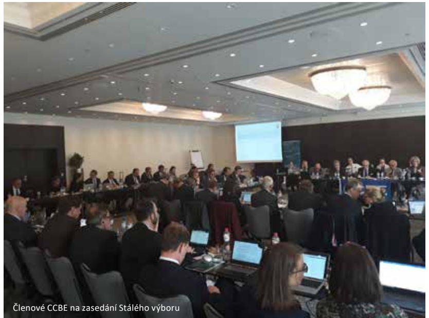
Členové CCBE na zasedání Stálého výboru

CCBE doporučuje všem čtenářům, aby se zaregistrovali na konferenci v Lille, která se bude věnovat dopadům umělé inteligence v oblasti justice a advokátní profese.