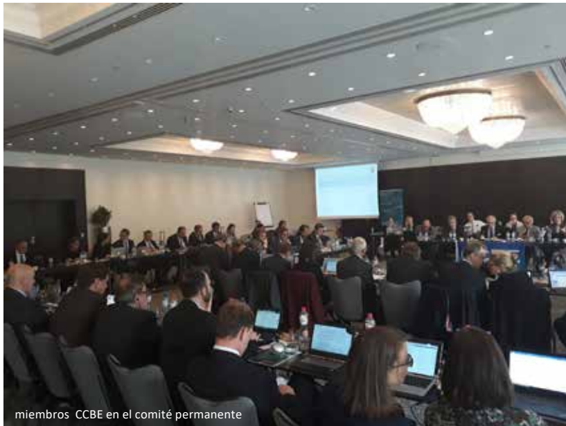
miembros CCBE en el comité permanente

CCBE recomienda a todos los lectores a registrarse para participar a dicha Conferencia, que se centrará en los efectos de la inteligencia artificial en materia judicial y la profesión de abogado.