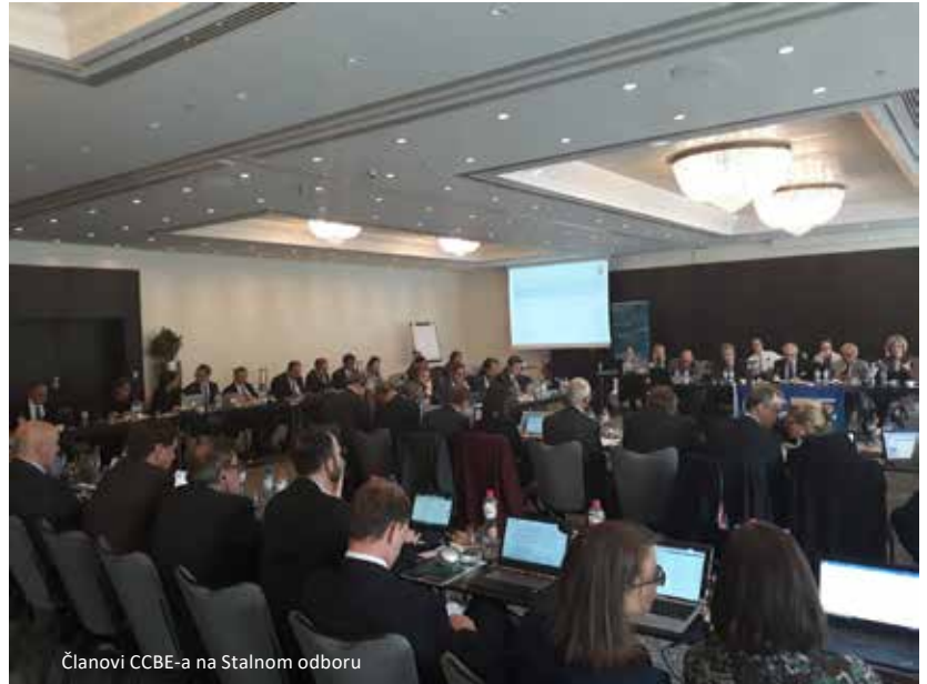
Članovi CCBE-a na Stalnom odboru

CCBE poziva sve da se prijave za konferenciju u Lilleu, na kojoj će se govoriti o utjecaju umjetne inteligencije na pravosuđe i odvjetništvo.