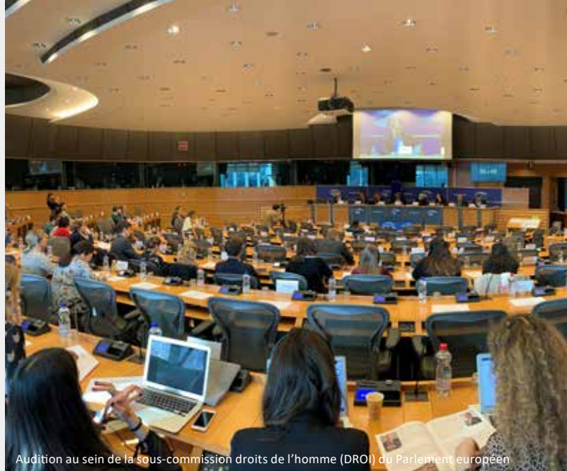
Audition au sein de la sous-commission droits de l’homme (DROI) du Parlement européen