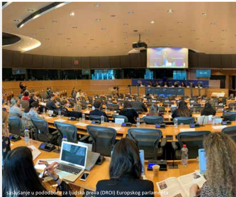
saslušanje u pododboru za ljudska prava (DROI) Europskog parlamenta