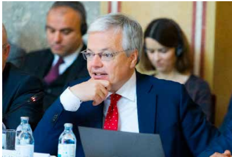
Didier Reynders