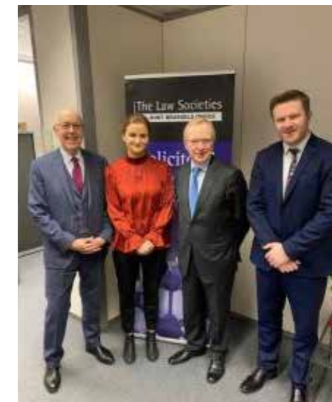
El LSNI asiste a la recepción anual en Bruselas