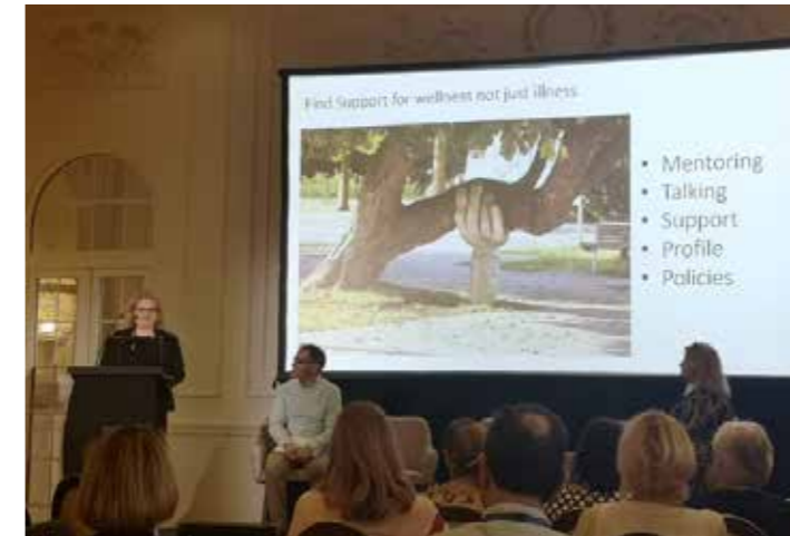
Conferencia de las cuatro jurisdicciones del LSNI