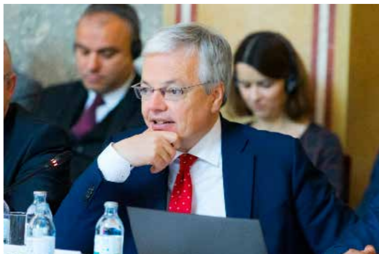
Didier Reynders