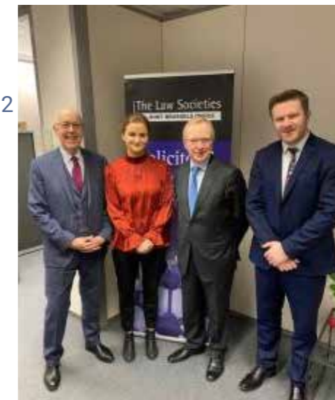
LSNI podczas dorocznego przyjęcia w Brukseli