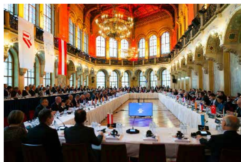
Konferencja prezydentów europejskich w Wiedniu

O rganizowana przez austriackie Stowarzyszenie prawników (ÖRAK) Konferencja prezydentów europejskich stała się przez kolejne dekady ważnym forum dialogu. W czasach tzw. żelaznej kurtyny była to bardzo często jedyna możliwość kontaktu i wymiany informacji przez prawników z obu stron. Dzisiaj Konferencja prezydentów europejskich to najważniejsze spotkanie prezydentów adwokatów, stowarzyszeń i samorządów prawniczych państw członkowskich i państw sąsiadujących z Unią.