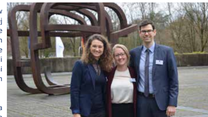
The winning team

Wybrano 31 zawodników z 17 krajów i podzielono ich na międzynarodowe zespoły. Pierwszym zadaniem było przesłanie pisemnego sprawozdania. Następnie uczestnicy wzięli udział w negocjacjach z zakresu prawa spółek i w inscenizacji rozprawy sądowej z zakresu prawa karnego.