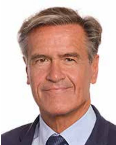
Juan Fernando López Aguilar, předseda Výboru Evropského parlamentu pro občanské svobody, spravedlnost a vnitřní věci