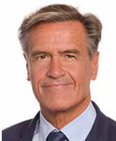
Juan Fernando López Aguilar, Presidente de la Comisión de Libertades Civiles, Justicia y Asuntos de Interior del Parlamento Europeo