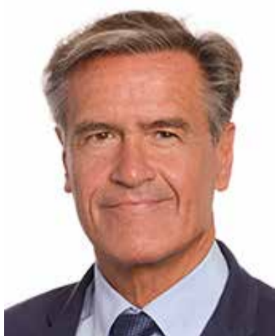
Juan Fernando López Aguilar, Président de la commission des libertés civiles, de la justice et des affaires intérieures du Parlement européen