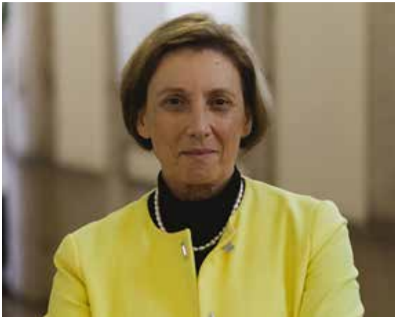
Anabela Pedroso, secrétaire d'État portugaise à la justice

Le CCBE a organisé un comité permanent en ligne le 26 mars au cours duquel Anabela Pedroso, secrétaire d'État portugaise à la justice, a prononcé un discours sur la numérisation de la justice dans l'UE.