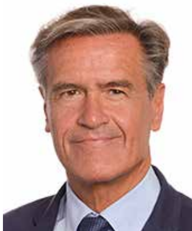
Juan Fernando López Aguilar, Presidente della Commissione per le Libertà Civili, la Giustizia e gli Affari Interni del Parlamento europeo