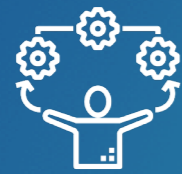
DÉLÉGUÉS À L'INFORMATION