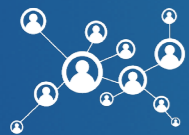
MEMBRES DE LA DÉLÉGATION