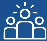
CHEFS DES DÉLÉGATIONS

i Cette partie du kit de bienvenue explique les principaux rôles de différents postes au sein du CCBE. Elle est donnée uniquement à titre d'information et doit être lue conjointement avec les statuts et le règlement d'ordre intérieur du CCBE.