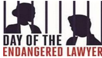
Foundation Day of the Endangered Lawyer