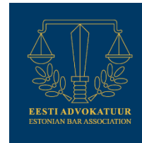
Estonie / Estonian Bar Association