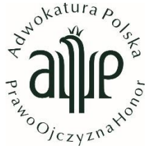
Pologne / Polish Bar Council