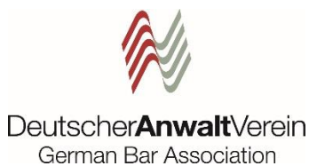
Allemagne / German Bar Association