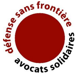
Défense Sans Frontière-Avocats Solidaires