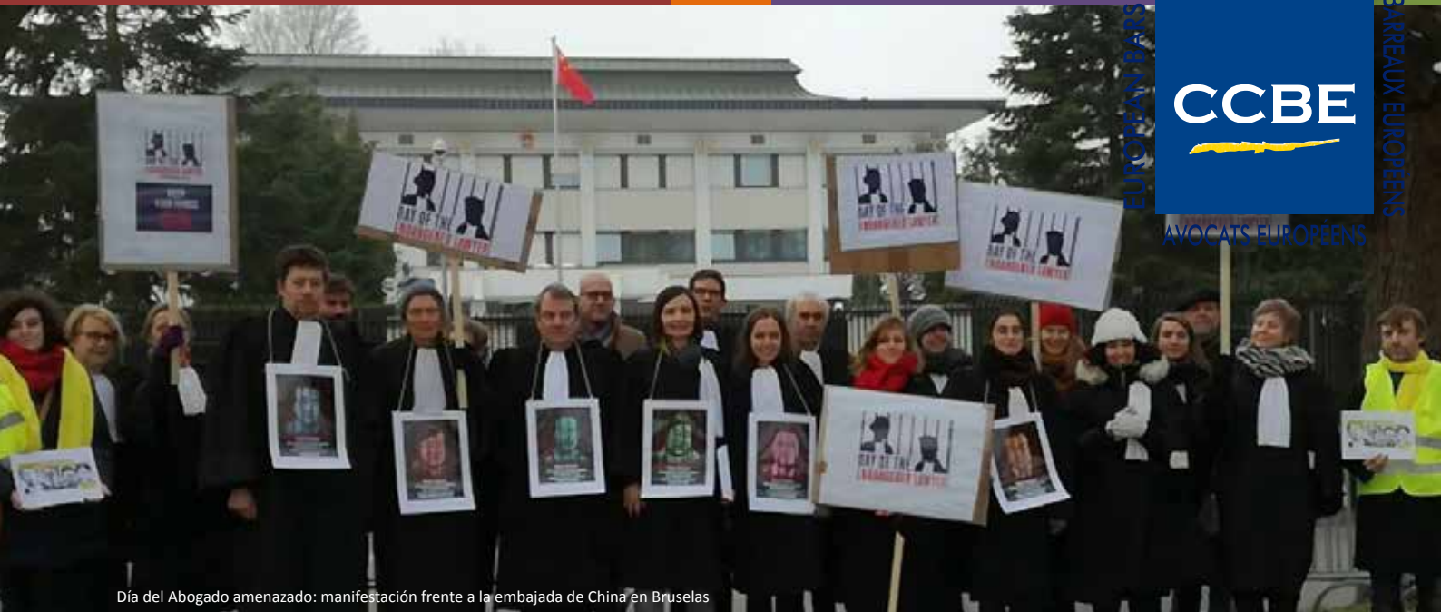
Día del Abogado amenazado: manifestación frente a la embajada de China en Bruselas