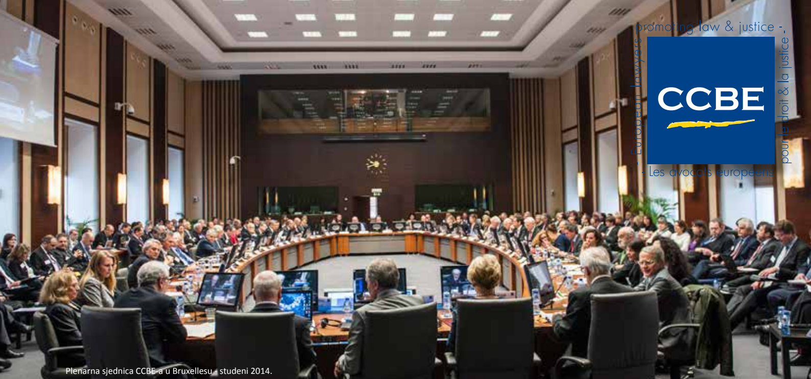
Plenarna sjednica CCBE-a u Bruxellesu - studeni 2014.