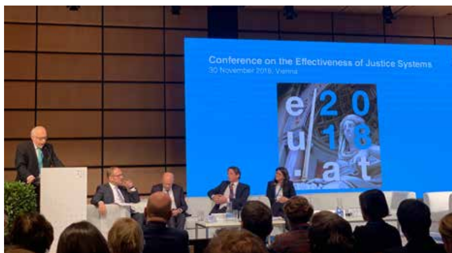
El presidente de CCBE, Antonin Mokry, pronuncia un discurso en la conferencia en Viena

El objetivo principal de la conferencia fue resaltar la independencia del poder judicial y la calidad y eficiencia de los sistemas de justicia en la Unión Europea y sus Estados miembros, elementos que son cruciales para defender los valores en los que se basa la UE, para la implementación y la observancia de la legislación de la UE, la confianza mutua entre los Estados miembros y un entorno favorable a las inversiones.