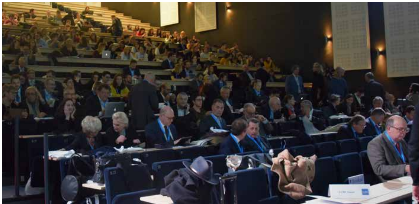
La conferencia de CCBE

preparó el escenario para las discusiones prácticas que tuvieron lugar en los diferentes talleres sobre los siguientes temas: Qué formación en el siglo XXI; Blockchain, contratos inteligentes; diseño legal; plataformas, ética y deontología; la calidad de los datos abiertos; la justicia predictiva y algoritmos; la oferta de servicios jurídicos en la era digital; hacia la justicia digital.