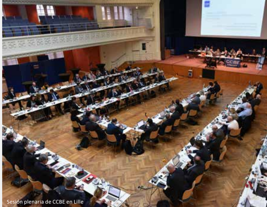
Sesión plenaria de CCBE en Lille